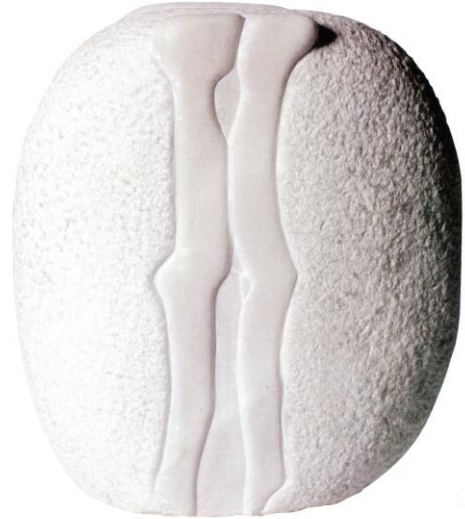
Κικιλαδίτι ο 'και Β' όψη, μάρμαρο Διονύσου, ύψος 20 εκ.

των λαλαριών, η Αργυρώ μετουσιώνει το σύνολο των εικόνων και των εμπειριών της σε έργο τέχνης. Η ίδια θεωρεί τον εαυτό της τυχερό που γεννήθηκε σε τέτοιο μέρος και που «η φύση μου έδωσε το χάρισμα να κάνω τέχνη στο μέτρο που μπορώ...». Ταυτόχρονα, ακούει την καθημερινότητα σε κάποιο καφενείο, σημειώνει στο μυαλό και τις αισθήσεις της τα χρώματα μιας παραλίας κι ενός χωριού, αναζητά στους μαστόρους τα πρώτα γράμματα της τέχνης που υπηρετεί και με την ξεχωριστή απλότητα και ευγένεια που την διακρίνει λαξεύει στο υλικό της εκφράσεις και μορφές του Κόσμου καθώς τα ονειρεύεται.