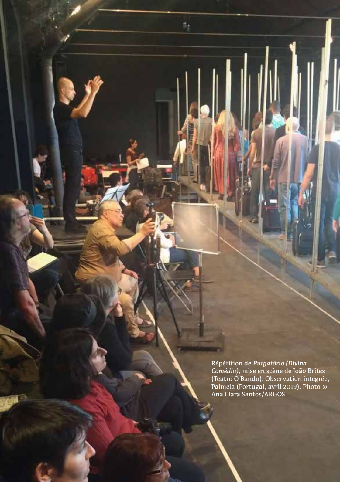
Répétition de Purgatório (Divina Comédia) , mise en scène de João Brites (Teatro O Bando). Observation intégrée, Palmela (Portugal, avril 2019).